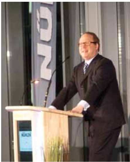
■ Prof. Dr. Max Otte

Mit diesen Worten begann der Finanzexperte Prof. Dr. Max Otte seinen Vortrag auf unserer Jubiläumsveranstaltung im Mercedes Autohaus Nühlen. Eine zentrale Botschaft des Abends ist ungewohnt beruhigend: „Europa steht nicht schlecht da“, sagte Otte. Im Vergleich mit den USA oder gar Schuldenweltmeister Japan sei Europa gut aufgestellt. Dass derzeit trotzdem das Gespenst von der „Eurokrise“ durch die Öffentlichkeit spukt, schreibt er auch politischen Interessen zu.