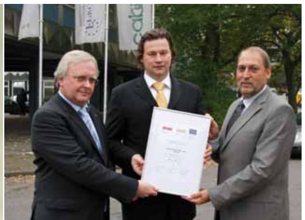
■ Urkundenübergabe zum Focus Money TOP Steuerberater 2007 in Duisburg.