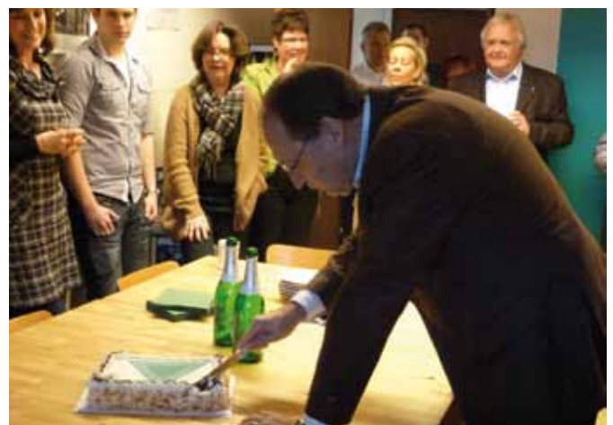
Die Chefs schneiden die GHP-Torte an