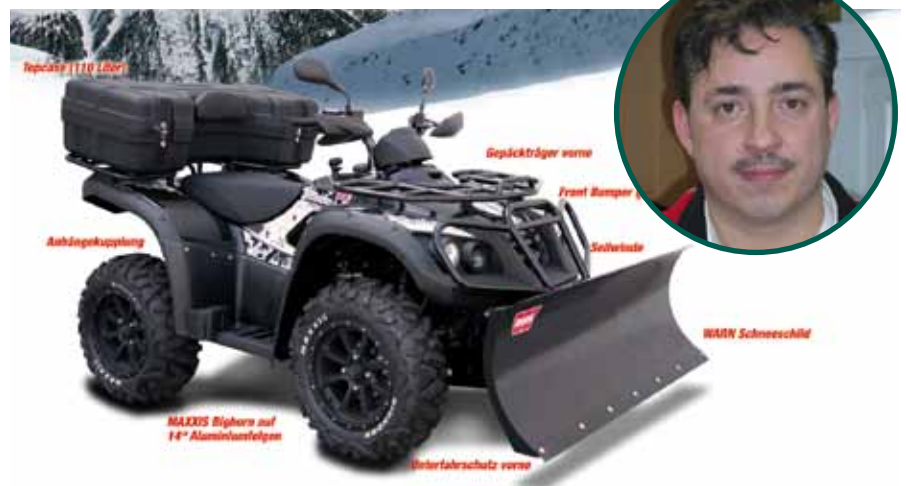
Limitierte Winteredition ATV's mit Schneeschieber

Telefon 0201 81587474 Telefax 0201 81587475 E-Mail kontakt@mrc-sued.de Internet www.mrc-sued.de