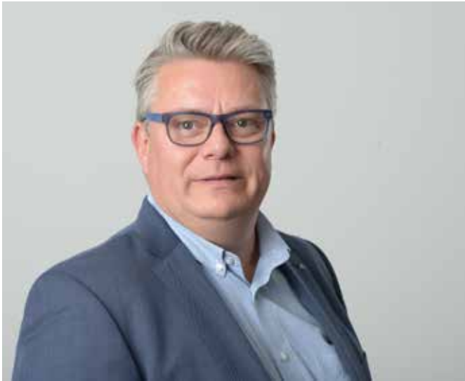
Frank Hüsken – © G-H-P

wesentlich schneller. Auch Anträge für Mandanten mit der Höchstsumme von 150.000 Euro wurden genehmigt. Ebenso erfolgte die Auszahlung recht zeitnah nach der Bewilligung.